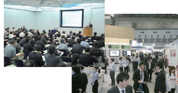
東京ビッグサイト会場風景（3日間開催）

※2018年より、eドキュメントJAPANは「デジタルドキュメント」に改称いたしました。